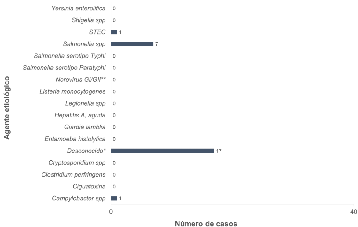
Gráfica 4. Incidencia acumulada de Enfermedades Transmisibles por Alimentos y/o Agua según el agente etiológico, semana epidemiológica 6, 2023 (N=26)

Nota: Datos obtenidos de National Electronic Disease Surveillance System (NEDSS) Base System (NBS). *Reportado como intoxicación alimentaria y/o gastroenteritis. **Casos corresponden a brote clasificado como brote por Norovirus según los criterios de Kaplan et al. (1982).