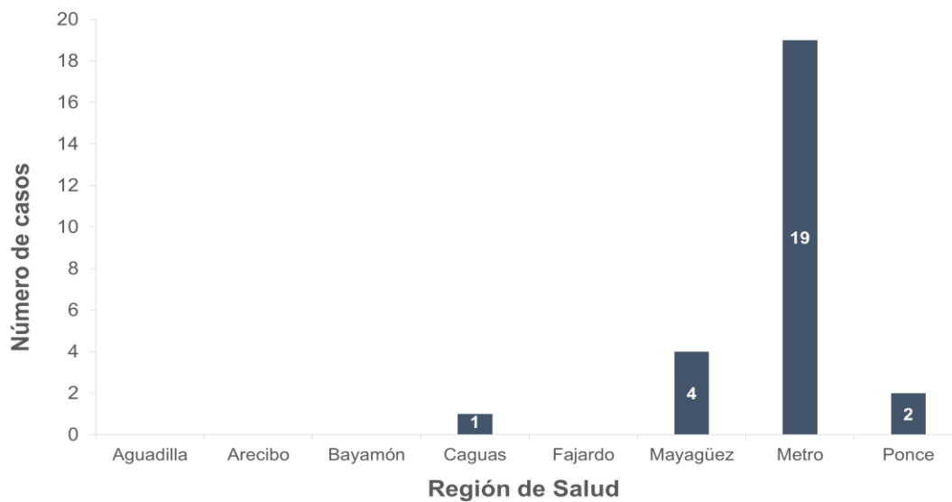
Gráfica 3. Distribución de incidencia acumulada de Enfermedades Transmisibles por Alimentos y/o Agua por región de salud, semana epidemiológica 6, 2023 (N=26)

Nota: Datos obtenidos de National Electronic Disease Surveillance System (NEDSS) Base System (NBS).